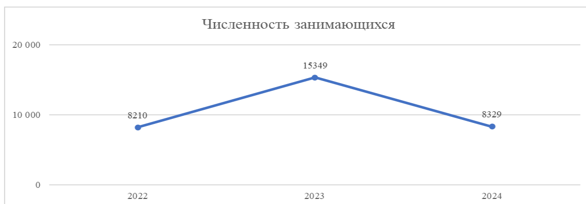
График № 1 Численность занимающихся 2022-2024 гг. по данным 1-ФК (по 2025 г. данные отсутствуют)