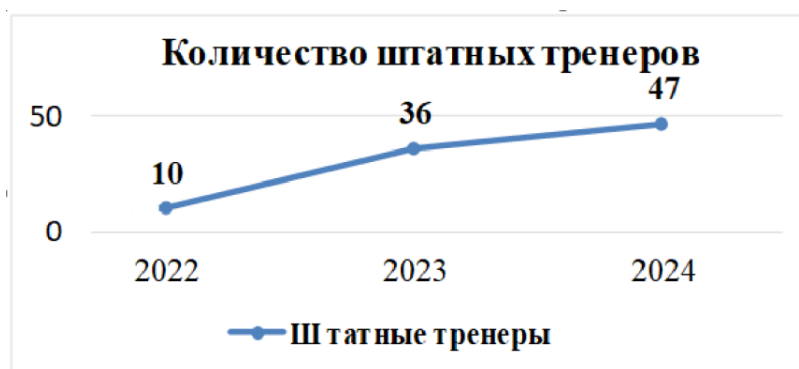
График № 4 Профильное образование штатных тренеров 2022-2024 гг. (по 2025 г. данные отсутствуют) по данным 1-ФК

График № 3 Количество штатных тренеров 2022-2024 гг. (по 2025 г. данные отсутствуют) по данным 1-ФК